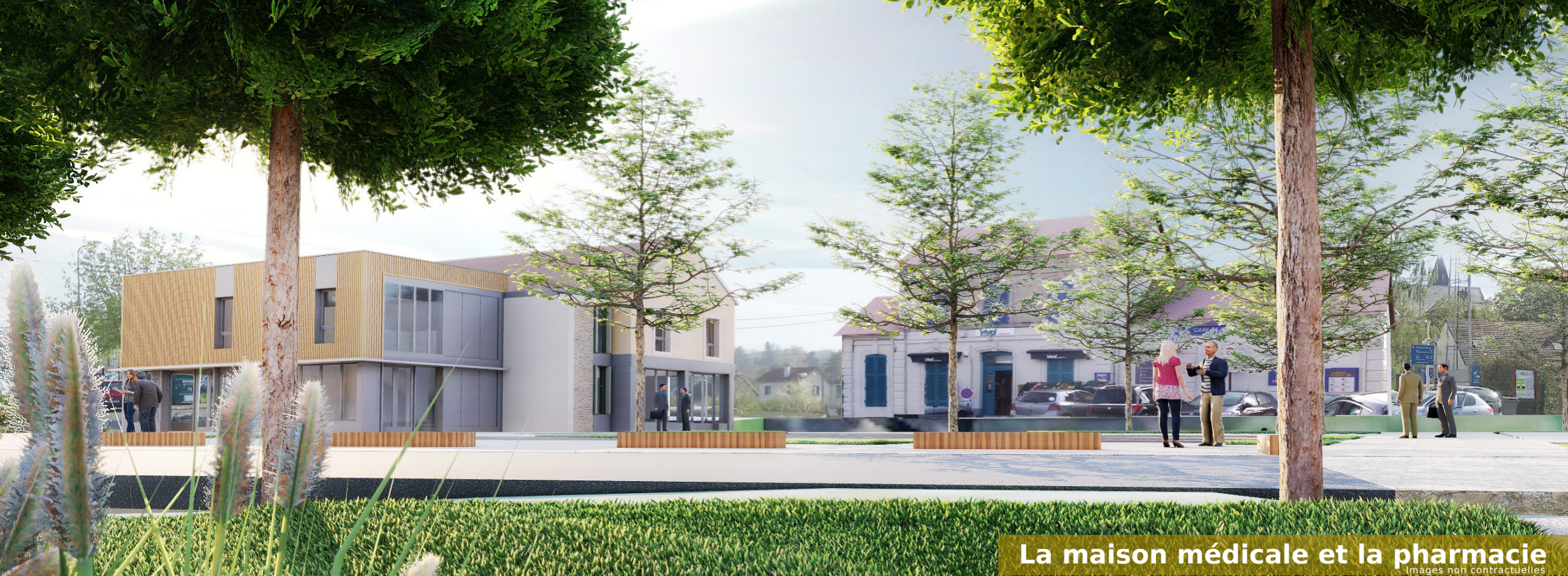
La maison médicale et la pharmacie Images non contractuelles

CUISINE ÉQUIPÉE SOLS PVC LOCAL DEUX ROUES CHAUDIÈRE GAZ INDIVIDUELLE VOLETS ROULANTS ÉLECTRIQUES CONSEIL ÉCOUTE CLIENT S.A.V. SAVOIR-FAIRE