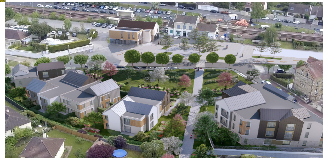
La résidence est idéalement placée à quelques pas de la gare SNCF.

Sa situation géographique est un véritable atout pour la qualité de vie de ses habitants qui bénéficient d'un cadre semi-rural à quelques minutes seulement de Paris.