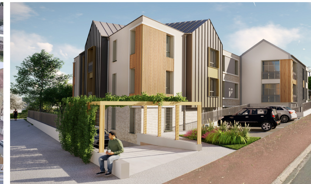
Une allée végétalisée traverse la résidence. Images non contractuelles